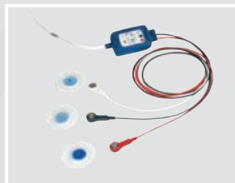
3 elvezetéses EKG kábel